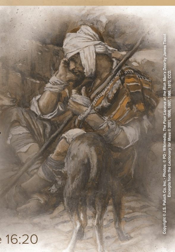
Copyright © J.S. Paluch Co. Inc. The Poor Lazarus at the Rich Man's Door by James Tissot. Excerpts from the Lectionary for Mass © 2001, 1998, 1987, 1986, 1970, CCD.